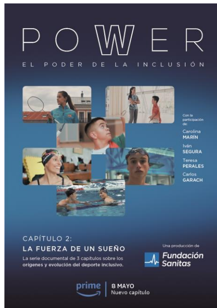
Power: la fuerza de un sueño