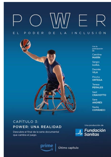
Power: una realidad