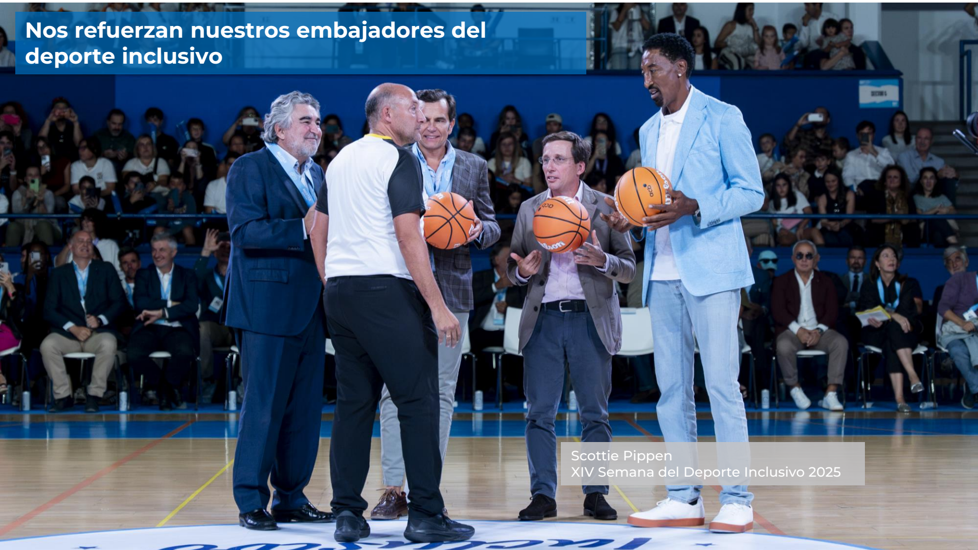
Scottie Pippen XIV Semana del Deporte Inclusivo 2025