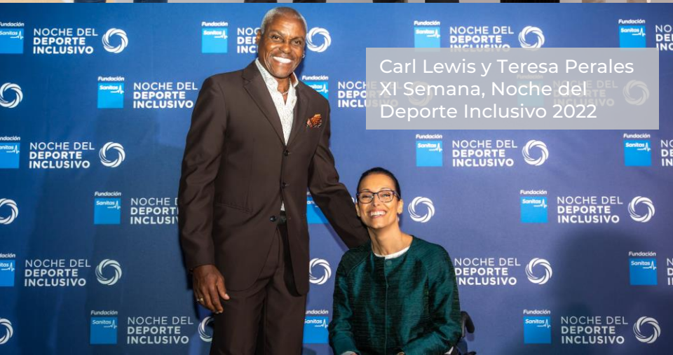
Carl Lewis y Teresa Perales XI Semana, Noche del Deporte Inklusivo 2022