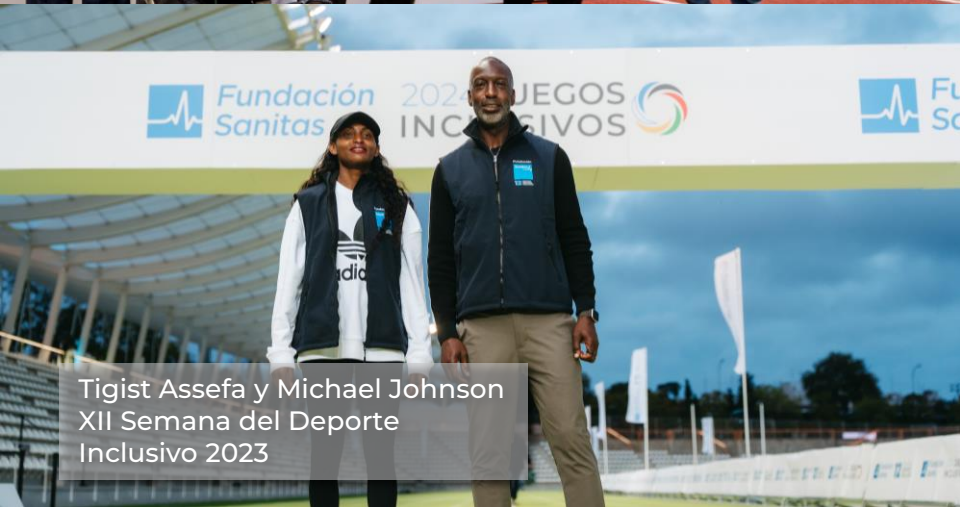
Tigist Assefa y Michael Johnson XII Semana del Deporte Inklusivo 2023