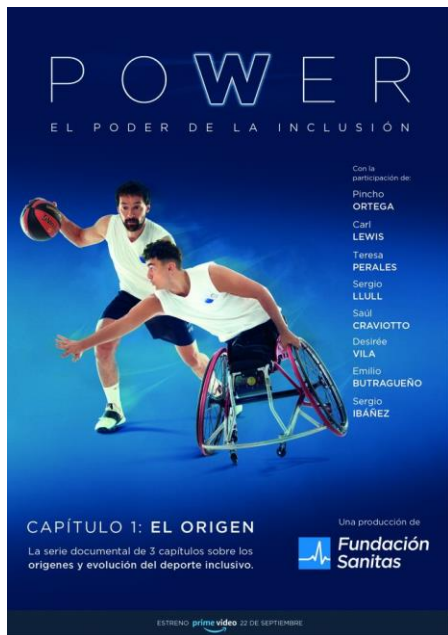
Power: el origen