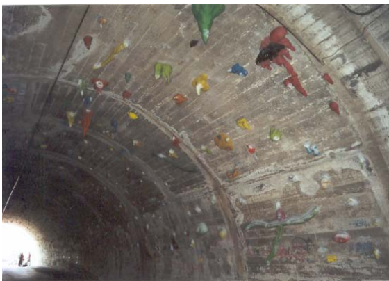
Escalada Túnel de la Fuxarda.Montjüit

Una vez detectada esta situación nos preguntamos sobre las ventajas que ofrece el deporte y las actividades deportivas al espacio público. En primer lugar hemos constatado que estas actividades han ayudado a urbanizar algunos lugares. En diferentes espacios se han puesto en marcha procesos que hemos catalogado como “acupuntores” 10 y que van desde la creación de instalaciones efímeras, que se montan y se desmontan en mismo día, a la conservación y modificación de otras por parte de los propios usuarios; al desarrollo y construcción de una instalación totalmente nueva y específica (rocódromo y petanca Avenida del Estatut. Bolos leoneses Plaza Clota), pasando también por la adaptación a instalaciones preexistente ( Túnel de la Fuxarda, Skate park Plaza Paisos Catalans...).