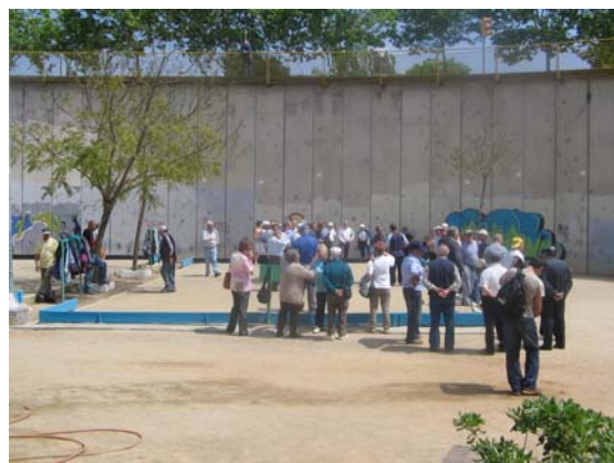
Petanca: Plaça Botticelli.

Los lugares específicos donde se han situado estas actividades deportivas también nos muestran unas características interesantes. Así encontramos actividades deportivas tanto en lugares centrales de la ciudad (skate en la plaza del Macba, o plaza Tres Chimeneas) como en lugares residuales de la misma, o "no lugares"- como un puente o un túnel. La incorporación de estas prácticas y de estos deportistas los han acabado convirtiendo en lugares (escalada en el túnel de la Fuxarda, Tanguilla debajo del puente de la calle Bac de Roda..).