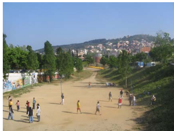
Ecuavoley. Avinguda de L'Estatut.

En una investigación del año 2005 9 contabilizamos un total de 72 redes sociales y 23 deportes diferentes que implicaban a un total de 2.200 personas (500 eran mujeres). Los orígenes de las personas que componían estos grupos eran también bien diferentes y nos encontramos con personas procedentes de Marruecos, China, R.Dominicana, Filipinas, Ecuador, Colombia, Pakistán, Cuba, Venezuela, Japón,. Eran muchas y variadas las personas que hacían deporte en el espacio publico, aunque curiosamente se veían más a unas personas y a unos grupos determinados que a otros, como era el caso de las personas de origen inmigrante. En la investigación pudimos comprobar como ésta era una apreciación errónea. En el caso de Barcelona las personas que mas deporte hacían en los 30 espacios públicos que observamos eran barceloneses en un 71% de los casos.