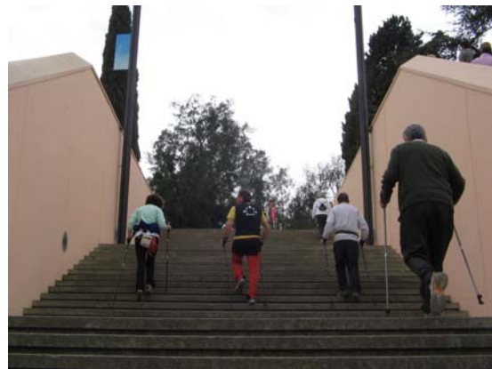
Nordic walking. Montjüit.

Las actividades deportivas en los espacios públicos ya consolidados también han ayudado a mejorar los mismos garantizando la diversidad de usos, la coherencia, la seguridad, la comunicación de una calle, de una plaza, de un barrio; en definitiva, el deporte en algunos espacios públicos vemos como en algunos casos ha ayudado a producir la redundancia necesaria para una vida cotidiana rica en experiencias Jacobs J. 11