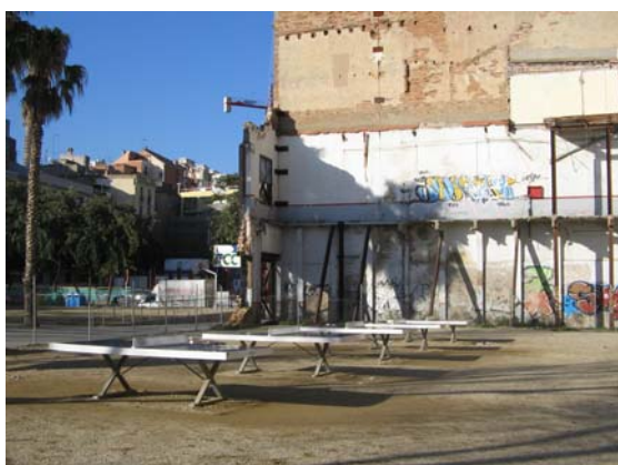
Ping-pong Portal de Santa Madrona

Otras controversias importantes a tener en cuenta respecto al espacio público contemporáneo, es que es un espacio cada vez más intervenido, más programado, más diseñado y finalmente más reglamentado. Un espacio muchas veces con vallas, con verjas, vigilado por cámaras, con horarios hasta llegar a perder casi su condición de público. Un espacio también cada vez más jurídico sobre el que han empezado a operar leyes hasta hace poco inexistentes como las denominadas Ordenanzas del civismo Barcelona 2006. El espacio público es también un espacio cada vez más serializado en su forma, repetido en su orden y contenido. Empieza a ser preocupante la aparición de muchos espacios públicos de deporte casi clonados como por ejemplo muchos skate parks 3 , o la saturación de canastas de baloncesto o de mesas de ping pong en algunos parques,... Algunos ayuntamientos en su deseo de incorporar a sus infraestructuras estos nuevos espacios públicos han acabado repitiéndolos hasta la redundancia o haciendo el encargo de diseño y construcción a los mismos promotores.