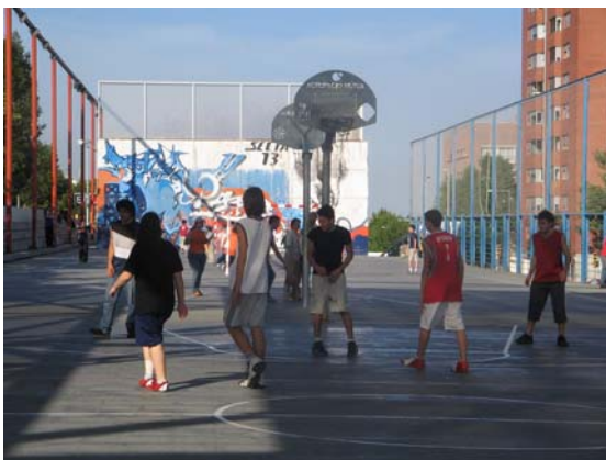
Baloncesto: Pistas Antoni Gelabert .

Otra característica es que estas prácticas deportivas habitualmente se apoyan en diferentes redes sociales, a través de las cuales muchos de sus practicantes se conectan. Estas redes son a veces específicas y en otras se encuentran mezclados jóvenes, con adultos, con inmigrantes y con turistas globales.