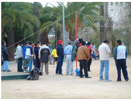
Ecuavoley.Parc de Joan Miró

Esta actividades deportivas así como los diferentes grupos que las practican se caracterizan también por tener estructuras organizativas en las que se combina lo formal con lo informal y a veces ambas cosas a la vez . Así podemos encontrar gente que no se conocen y juegan solo o acompañados si se presta la ocasión (partidos de basket informales en el parque de la España Industrial) o grupos regulares y formales, como las que tienen los equipos de jugadores de petanca, de "bitllas" catalanas o de bolos leoneses en diferentes plazas de la ciudad de Barcelona.